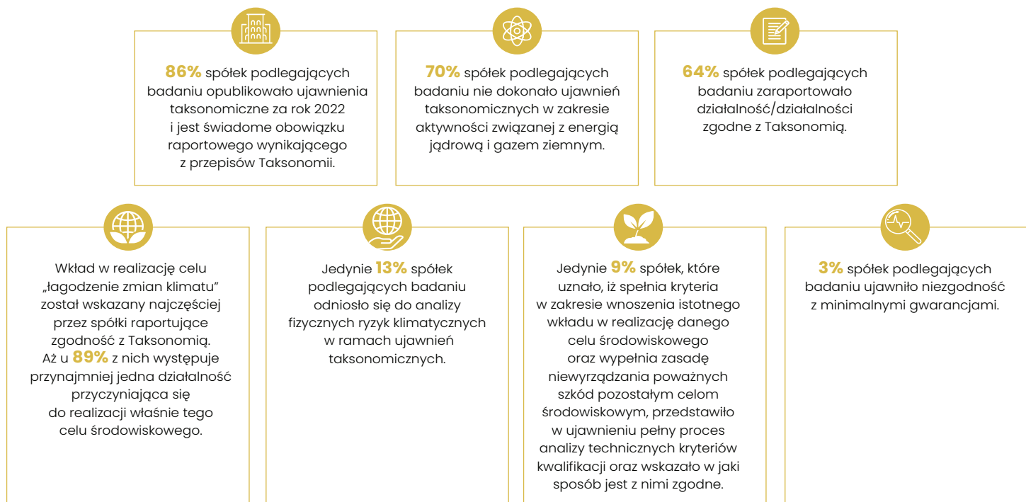
Wykr. 1. Analiza ujawnień taksonomicznych 137 polskich spółek giełdowych